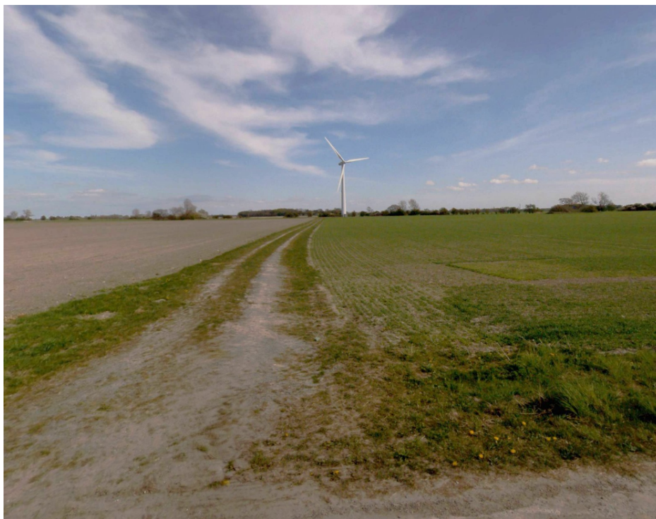
Figur 2: Gadefoto af vindmøllen set fra Lindelsevej pr. 2022. Udsigten vil fremstå uændret fremadrettet.

Der er tale om en enkeltstående vindmølle med en navhøjde på 35 meter og rotordiameter på 41 meter. Møllen er lovligt opført i 1995 og ansøger har oplyst, at der i forbindelse med udstykningen vil blive tinglyst deklaration om tilbageførsel og vingeoverslag. Møllen er placeret i landzone ca. 850 meter fra kysten.